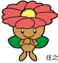
住之江区マスコットキャラクター さざびー

障がいを持つ子どもたちたちに日々かかわっておられる保護者の方々と、さまざまな分野の専門家をお呼びして、ともに学ぶ研修会です。たくさんの方のご参加をお待ちしております。