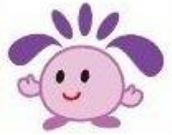
住吉区マスコットキャラクター すみちゃん

障がいを持つ子どもたちたちに日々かかわっておられる保護者の方々と、さまざまな分野の専門家をお呼びして、ともに学ぶ研修会です。たくさんの方のご参加をお待ちしております。