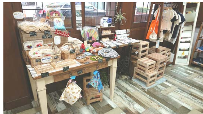
丸紅基金さまより「らふら」整備に助成をいただきました

11月4日（日）～5日（月）、障がいグループホームだいくかのんで一泊旅行に行ってきました。宿泊先はワールド牧場のコテージ。山の上からの夜景が最高でした。ワールド牧場内も散策。動物達といっぱいふれあえました。向こうからエサめがけてあまりにもふれあってくるので、逃げ出したメンバーさんもいました（笑）。夕食は豪勢に焼肉です。ワールド牧場で取れた食材もあり、めっちゃおいしかったです。あと白ごはんが最高に美味しすぎてメンバーさんもスタッフもおかわりしてしまいました。