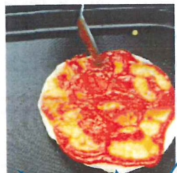
粉をこねて、生地づくり