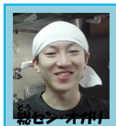
総セン・オガリ 就労B(田畑)