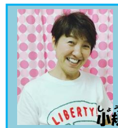
さかき 小規模(阪木)