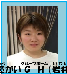
グループホーム 障がいG H(岩井)