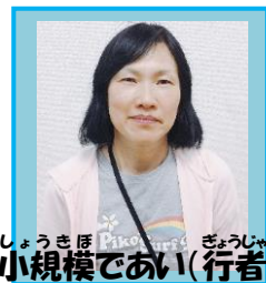
しょうきほ 小規模であい(行者)