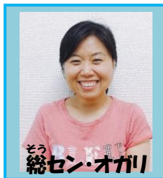
総セン・オガリ 生活介護(磯口)