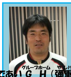
グループホーム であいG H(彌重)