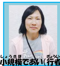
しょうきほ 小規模であい(行者)