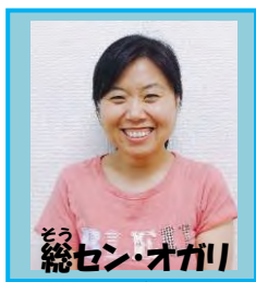
総セン・オガリ 生活介護(磯口)