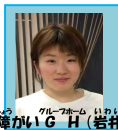
グループホーム いわい 障がいG H (岩井)