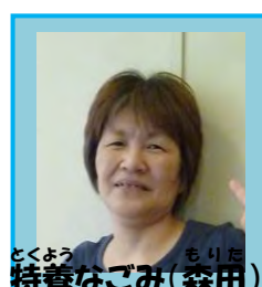
もりた 特養なごみ(森田)