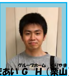
グループホーム いやま であいG H (栗山)