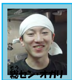
総セン・オガリ 就労B(田畑)