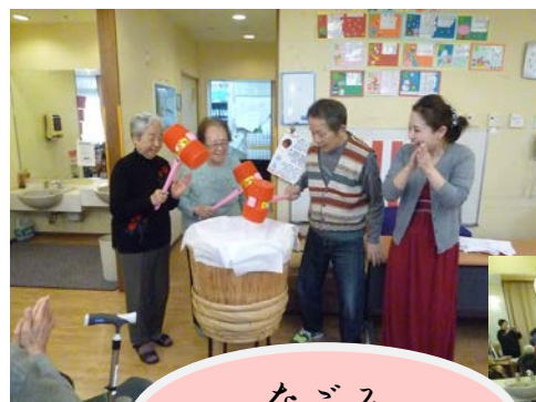
なごみ デイサービス