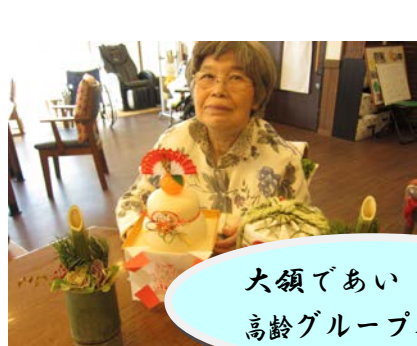
大領であい 高齢グループホーム