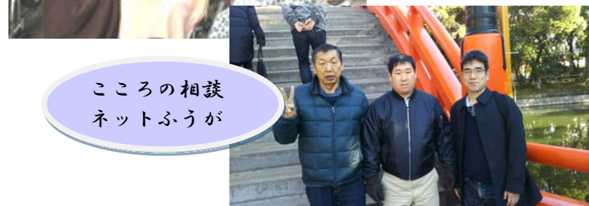
こころの相談 ネットふうが