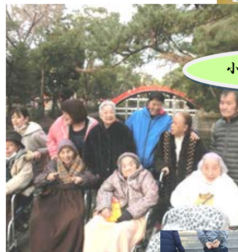
小規模多機能さずな