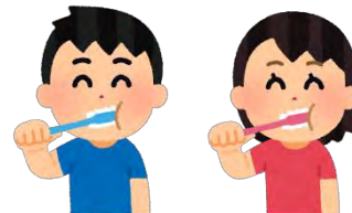
はみが歯磨きごとの消毒