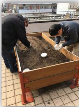
たね 種まきの様子 ようす