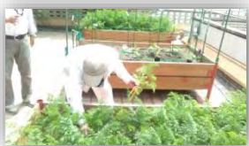
まびき 間引き作業をおこないました。 さぎょう