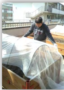
まだ寒かったので、シートをかけていました。