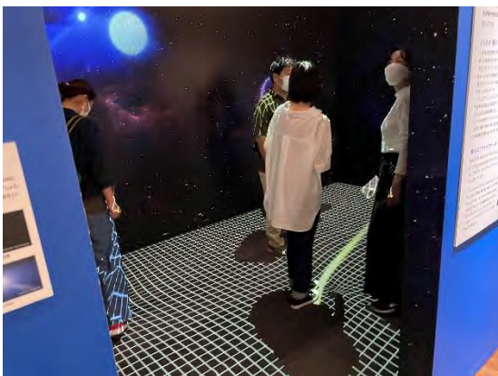
左上: アインシュタインの書齋にて 上の真ん中&左下: 時空が歪む不思議な空間 右: スーパーカミオカンデ(日本にある世界最大の宇宙 素粒子を観測する機械)の写真前にて