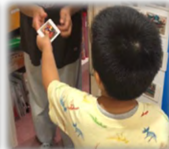
欲しいものを相手に伝える