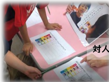
対人境界について学ぶ