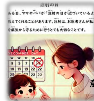
意味合いを理解する